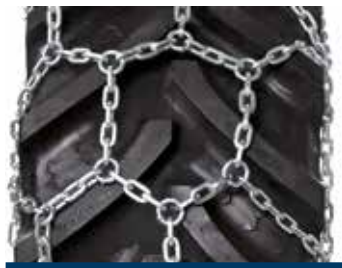
Střídavě uspořádané provedení