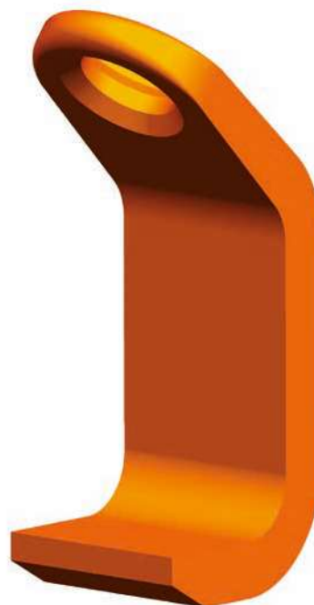
BWW Stohovací hák na plech

Dbejte na to, že zatížení špičky háku není povoleno, a že háky musí zcela přilnout k nákladu. Doporučuje se použití min. 3 pramenného závěsu s ideálním úhlem sklonu 15° až 30°. Stohovací hák je dodáván s označením CE a návodem k použití.